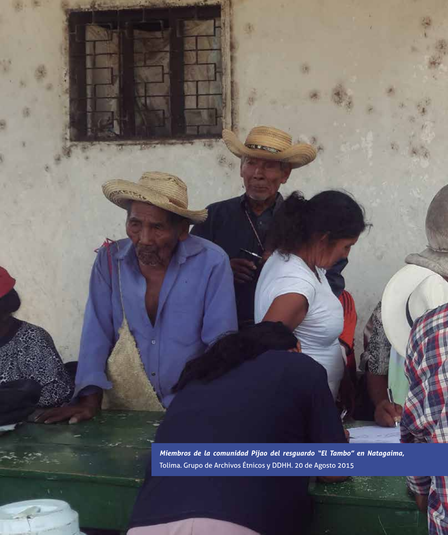
Miembros de la comunidad Pijao del resguardo "El Tambo" en Natagaima, Tolima. Grupo de Archivos Étnicos y DDHH. 20 de Agosto 2015